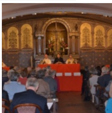
Crypte de Saint-Augustin