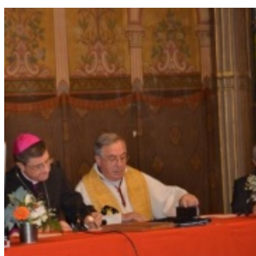
Signature de Mgr de Moulins-Beaufort