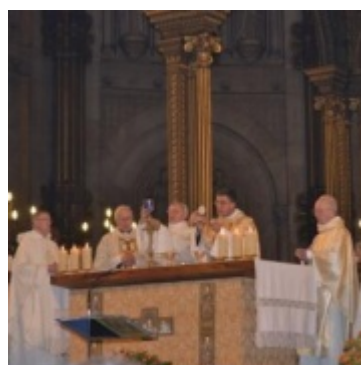
Messe d'action de grâce